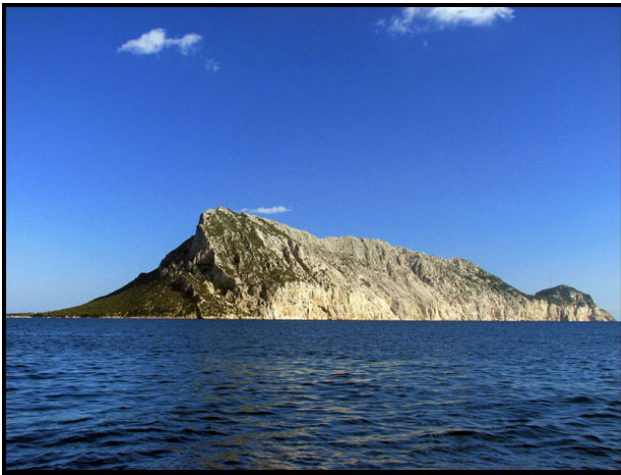
Autore : Mikolaj Kirschke