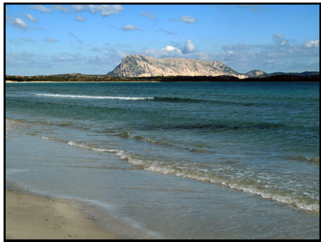
Autore : Nikkis